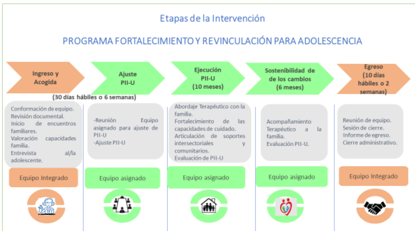
Figura 1. Cuadro etapas de la intervención.

Antes del ingreso de los/las adolescentes al Programa de Acogimiento Residencial Terapéutico y al Programa de Fortalecimiento y Revinculación Familiar se requiere que el espacio físico se encuentre habilitado, que estén definidas las funciones y los roles de cada profesional y técnico del Equipo Integrado, así como las relaciones entre ellos. Asimismo, todo el equipo debe estar capacitado en la práctica informada